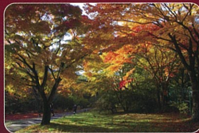
伊香保露天風呂、県立伊香保森林公園周辺なども紅葉の名所です。

その湯元「河鹿橋」付近には榛名山系の豊かな自然に育まれた、もみじ、かえで、くぬぎ、うるしなどが自生しています。これらの樹々の紅葉は、毎年10月下旬から一斉に色づき始め、11月上旬にはピークを迎えます。ライトアップに浮かび上がる、幽玄な夜の紅葉をお楽しみください。