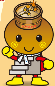
伊香保温泉キャラクター 「いしだんくん」