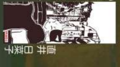
33 懐かしいお祭り 榎田桃子