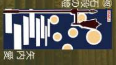
24 石段と十二支 榎田桃子