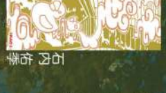
14 河鹿と紅葉 矢内愛