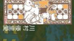
13 移る心と河鹿橋 榎田桃子