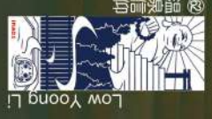
31 箱の月あかり 北嶋輝葉