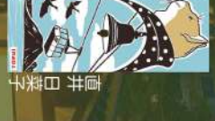
20 伊香保でときめき探し 榎田沙希