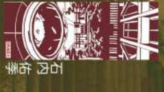
26 滝と石段街 川村優里愛