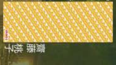
19 賑やかな湯への段 齋藤桃子