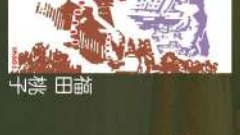
35 眺む伊香保温泉石段街 榎田桃子