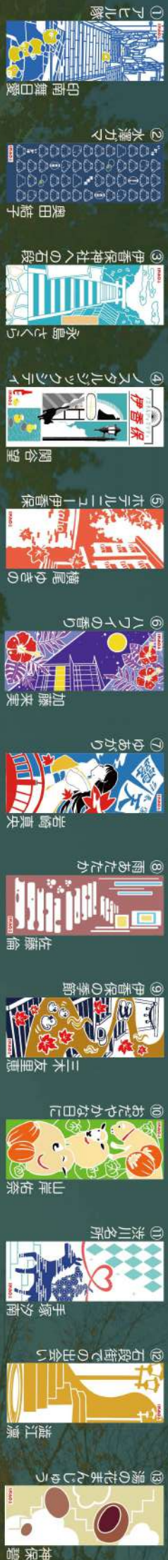
1 アヒル隊 印南舞白燐