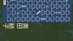
7 ゆあかり 光崎真央