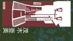
12 石の上のあひる 加藤悠夏