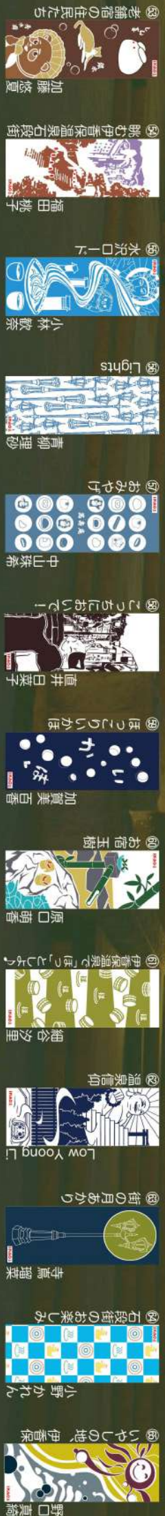
29 いやしの地 伊香保 野口真穂