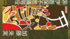
17 カミンロン 光崎真央