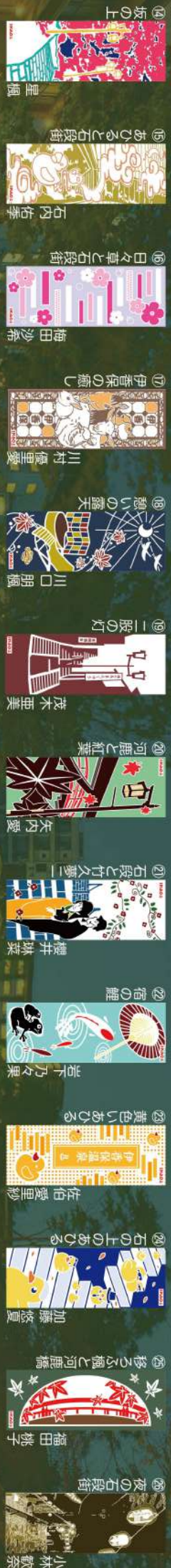
8 夜の石段街 小林敦泰