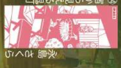
18 何から見える燈籠 永島ぞくろ