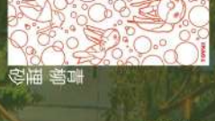
21 石段 中山珠希