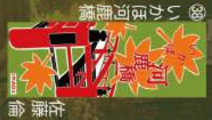
16 いか世河鹿橋 辻藤倫