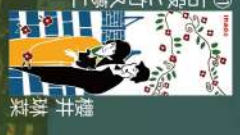
11 山川名所 手塚夕南