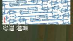
34 水鏡ごころ 小林敦泰