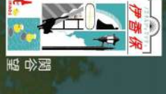
6 ハコイの香り 加藤采実