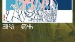
28 石段の彩り 手塚夕南