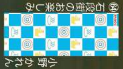
30 石段街のお楽しみ 小野かれん