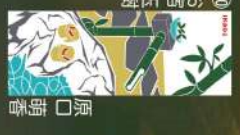
32 伊香保温泉でほっこり 榎谷夕里