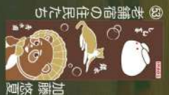
36 考煙の住民たち 加藤悠夏